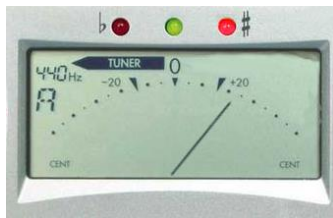
Note trop haute, il faut descendre .