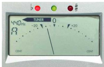
Note trop basse, il faut monter .

Exemple avec la note « la », cinquième corde (note accordée A)